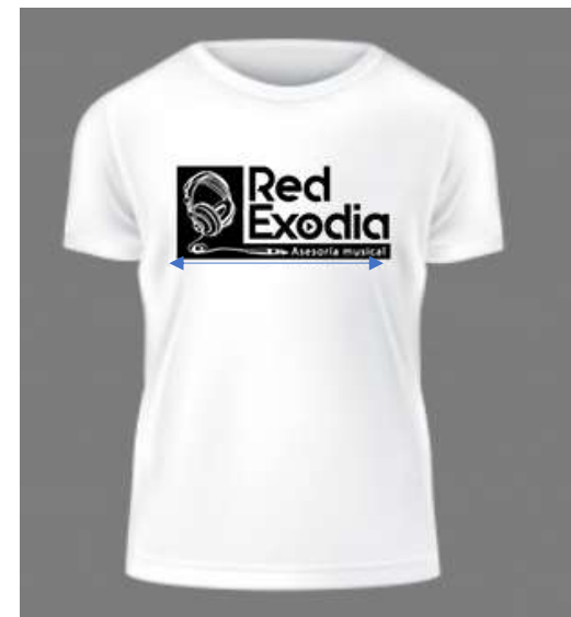
Polera largo logo 18 cms